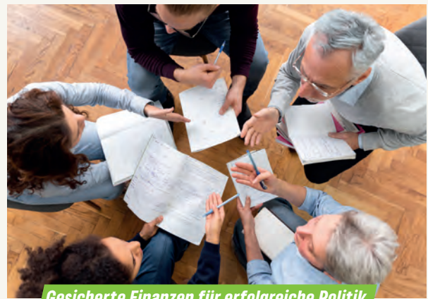
Gesicherte Finanzen für erfolgreiche Politik

Wir sind 2020 angetreten, den städtischen Haushalt mittelfristig strukturell auszugleichen. Dafür gehen wir nicht in die Substanz, also an das Eigenkapital der Stadt. In den vergangenen fünf Jahren ist es uns gelungen, den Haushalt zu stabilisieren.