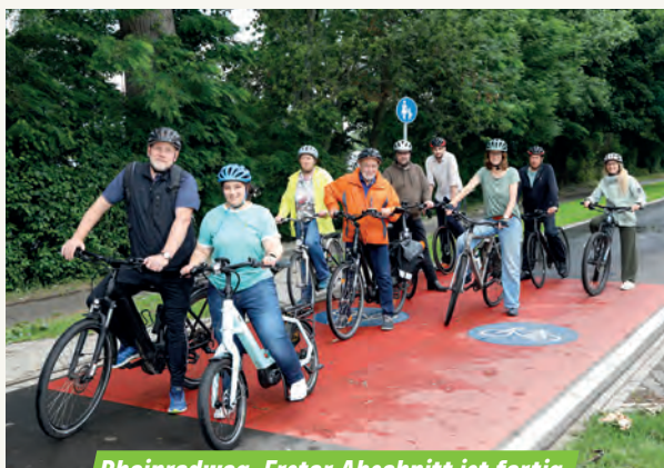
Rheinradweg: Erster Abschnitt ist fertig

Ein Beispiel ist die Mobilitätswende. Unsere Stadt liegt größtenteils in geschützter Natur. Grundsätzlich ist dies ein Pluspunkt für unsere Umwelt und damit auch für uns Menschen.