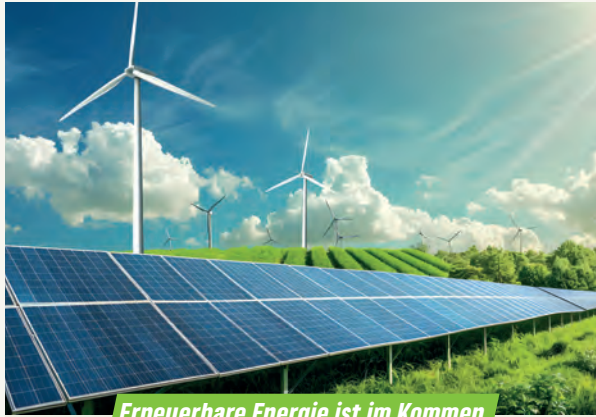
Erneuerbare Energie ist im Kommen

Durch das schon im dritten Jahr laufende Klimaschutzförderprogramm werden die Bürgerinnen und Bürger auf diesem Weg mitgenommen, u.a. durch Förderung von Steckersolargeräten, die als wichtiger Baustein für lokale Energieversorgung dienen.