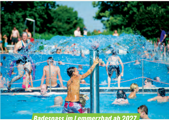
Badespass im Lemmerzbad ab 2027

Auch das Lemmerz-Freibad wurde durch versäumte Investitionen in den letzten Jahrzehnten massiv geschädigt. Jetzt kann es endlich mit modernster Technik und nachhaltig saniert werden. Ab der Badesaison 2027 soll es in neuem Glanz erstrahlen und zahlreiche Badegäste anlocken.