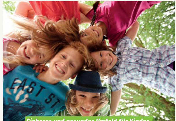
Sicheres und gesundes Umfeld für Kinder

Wir setzen uns konsequent für Kinder und Jugendliche ein. Die Pandemie hat tiefe Furchen hinterlassen, und es bedarf stetiger Anstrengung, der nächsten Generation eine Perspektive zu geben. Das beginnt bereits bei den Betreuungsplätzen in Kita und OGS. Der Rechtsanspruch auf einen Platz reicht nicht, es braucht Qualitätsstandards und muss bezahlbar bleiben. Durch die weitere Entlastung unterer Einkommensgruppen bei den Elternbeiträgen wurden wir dieser Aufgabe gerecht, trotz knapper kommunaler Finanzmittel. Auch die konkrete Beteiligung der jungen Zielgruppe bei Entscheidungen wie dem Spielplatzbau ist inzwischen durch eine Initiative neuer Bürgerbeteiligung etabliert. Größeren Anstrengungsbedarf sehen wir noch in der Aufgabe als Schulträger. Wir müssen wieder mehr investieren, um den Sanierungsstau in den Schulen zu beseitigen, die Ausstattung zu verbessern und Digitalisierung als zusätzliche Chance verstehen.