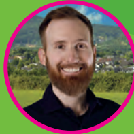
Paul Barmen Vinxel/Stieldorferhohn